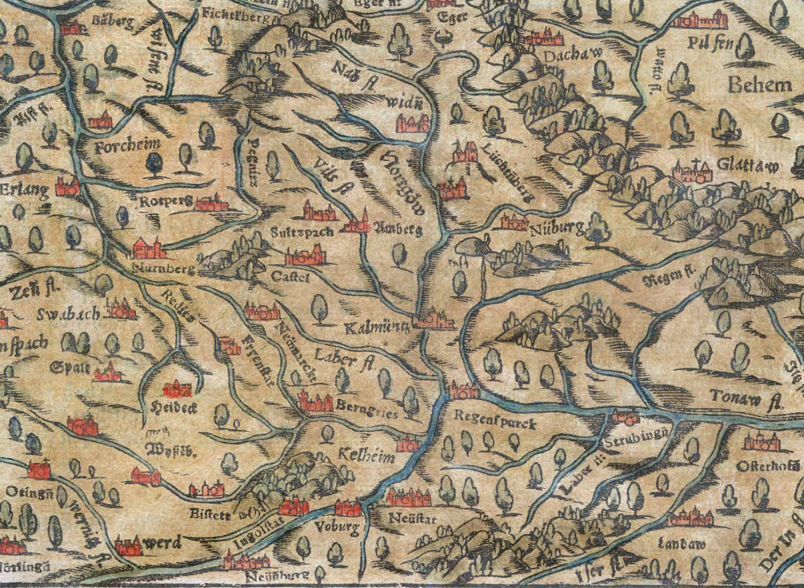
Sebastian Münster, Karte vom Nordgau, aus der Cosmographia von 1628.